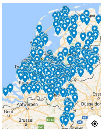
Verpleeghuizen in NL (ZorgkaartNederland, 2022)

Volgens Zorgkaart Nederland telt Nederland in 2022 in totaal 2358 verpleeghuizen, 54 daarvan heeft bij de Parkinson Vereniging aangegeven parkinsonexpertise in huis te hebben. Dat varieert van een diëtiste die aangesloten is bij ParkinsonNet, het organiseren van een Parkinson café, tot het hebben van een geclusterde parkinsonwoonafdeling. Uit het VIP2 project blijkt dat slechts in 10 van de 54 van deze verpleeghuizen mensen met parkinson op een gespecialiseerde parkinsonwoonafdeling geclusterd kunnen wonen. Dat komt neer op zo'n 200 woonplekken in Nederland.