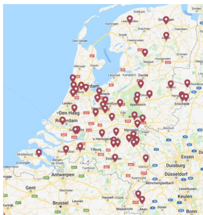
Verpleeghuizen met parkinsonexpertise (gemeld bij Parkinson Vereniging, 2022)