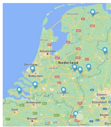
Verpleeghuizen met parkinsonwoonafdeling (VIP2, 2022)

Met grote regelmaat krijgt de Parkinson Vereniging vragen over parkinson in het verpleeghuis. Mantelzorgers maken zich zorgen over de kwaliteit van zorg, beschrijven de onervarenheid van zorgverleners met de ziekte en voelen zich ook nog tijdens de verpleeghuisopname verantwoordelijk voor het zorgproces. Die verantwoordelijkheid is voor veel mantelzorgers een te grote last omdat zij juist overbelast zijn geraakt toen degene voor wie ze zorgden nog thuis woonde. Medicatie wordt onjuist aangeboden (verkeerd tijdstip en/of met verkeerde voeding), er is onbegrip voor on- en off-fasen. Mensen met de ziekte van Parkinson wonen in het verpleeghuis vaak onterecht samen met